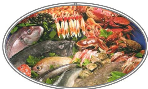
Disfruta de la Cocina Gallega