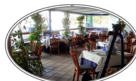
Terraza Climatizada Verano - Invierno