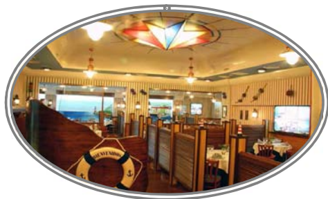
Momentos, Siempre Recordados