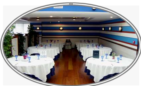
Cóctel, Cooffe Break, Presentaciones